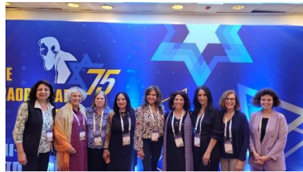
נשות משלחת ארגון בני ברית בקונגרס הציוני 2023

בקונגרס הציוני העולמי המציין 125 שנים לקונגרס הראשון בבאזל שהתקיים בבנייני האומה בין התאריכים 19-21.4.23 השתתפה גם משלחת מטעם בני ברית ישראל עם משלחת בני ברית העולמי שארגן מר אלן שניידר, מנהל המרכז העולמי בירושלים.