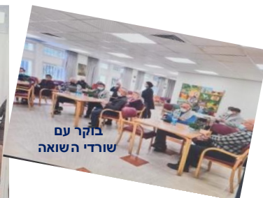
בוקר עם שורדי השואה