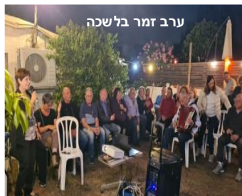
ערב זמר בלשכה