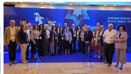
משלחת ארגון בני ברית בקונגרס הציוני

השנה הקונגרס נערך לרגל 75 שנות עצמאות מדינת ישראל והשתתפו בו