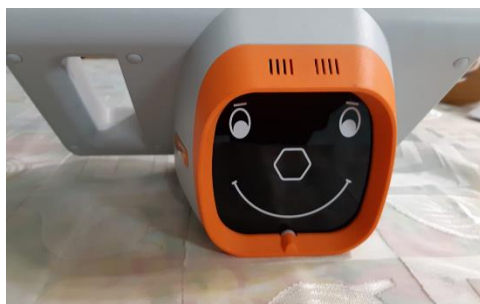
מכשיר לבדיקת עין עצלה

כפי שציינו קודם חברינו מתנדבים גם באופן אישי בקרב ניצולי שואה, "אנוש", התרמות דם, ביטוח לאומי (יעוץ לציבור"), חנות יד שניה ("קיימותא"), "ער"ן, "כל יכול", "נשות הדסה", אחזקת בית האמנים בראשל"צ ועוד.