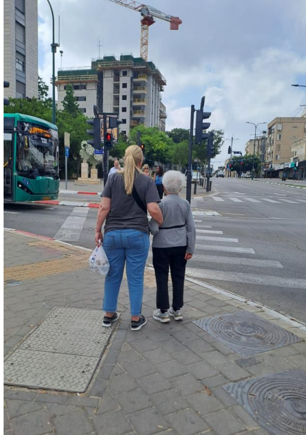
רחובות, רחוב הרצל, מאי 2023