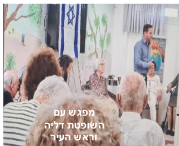
מפגש עם השופטת דליה וראש העיר