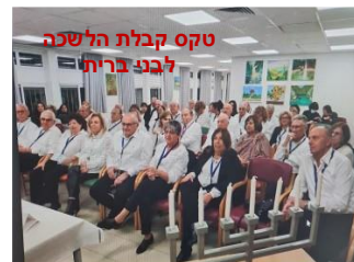
טקס קבלת הלשכה לבני ברית