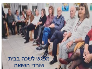
מפגש לשכה בבית שורדי השואה