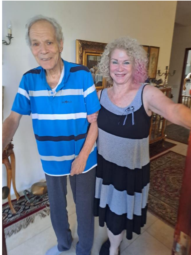
זוג צעיר, גיל הזהב. ראשון לציון יולי 2023