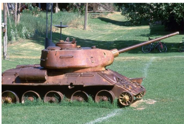
הטנק T34 הסורי ליד חדר האוכל בקיבוץ דן

בן גוריון לחץ על הקיבוץ להחזיר את הנשק לצה"ל, התנהל מו"מ עיקש שבסופו סוכם שנשק פרטי חוזר לקיבוץ. כך הוחזר הנשק לסליק בקיבוץ באופן חוקי... כמובן... מלבד המקלעים הכבדים. בזמן שבקרבות רבים חסרו נשק ותחמושת, בכפר גלעדי נאגרו אמצעי לחימה שנשכחו משך שנות דור, עד לגילויים מחדש.