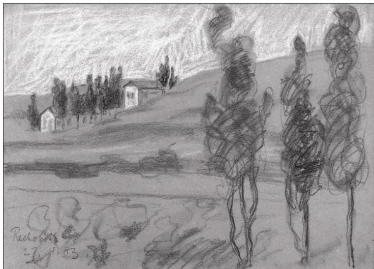
בית נחומזון בנימין 35 רחובות, צייר הרמן שטרוק 1903

שטרוק בחר להראות את שני הבתים במעלה רחוב בנימין כמייצגים את נוף המושבה כאשר באותה עת כבר עמדו למעלה מ-20 בתים ברחובה הראשי, ברחוב יעקב. ייתכן, כי שטרוק התרשם מהגבעות הנישאות, משני צדדיו של הגרעין ההיסטורי האורבני של רחובות, מצד מזרח מעלה רחוב בנימין ורחוב מנוחה ונחלה ומצד מערב גבעת האהבה וגבעת יוספזון.