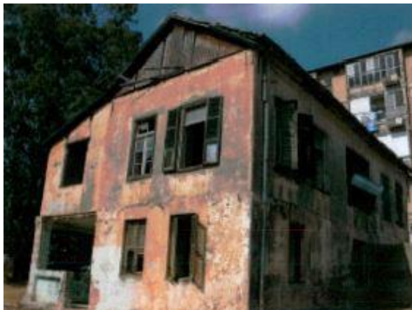
חזית מערבית ודרומית, מ.ד. אשכנזי אדריכלים, תיק תיעוד