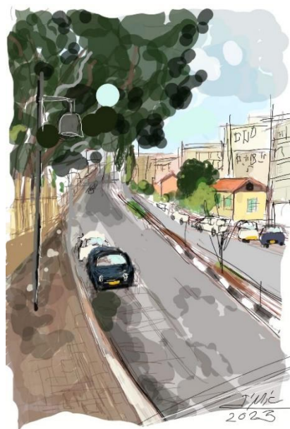
בית נחומזון, אייר מיכאל זלטקין 2023

באותה תקופה הכיר פן את המשורר אברהם שלונסקי. נראה כי השניים נפגשו לראשונה בעת ששלונסקי שהה בבית הבראה "מרגוע" שברחובות. פן הגדיר את פגישתם כ"פגישה מקרית", אך בעברית בארץ. פן טען לא רק שעלה ארצה במקרה וללא קשר לציונות אלא גם שבבואו ארצה לא ידע כמעט עברית.