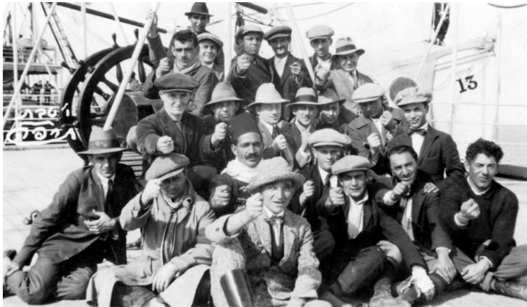
אנשי "חבר'ה טראסק" מציגים לראווה את סמלם המסחרי, האצבע המשולשת. צולם בשנת 1925, באדיבות ביתמונה

אברהם שלונסקי חיבר עבורם את "המנון הטראסק" והתייחס לכך בשיר: