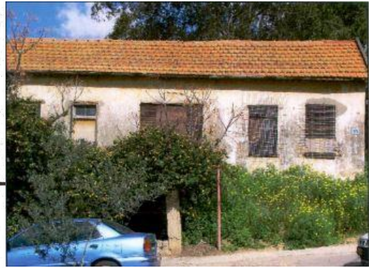
חזית מבנה לרוחב בנימין מ.ד. אשכנזי אדריכלים, תיק תיעוד