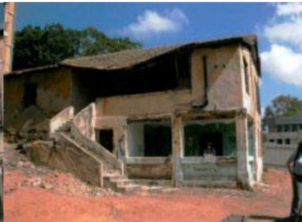
מראה חזית אחורית צד צפון, מ.ד. אשכנזי אדריכלים, תיק תיעוד