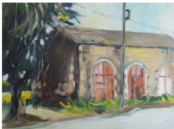
בית האסמים 2009, רחוב גורודיסקי 2 ציירה: תמר גודר