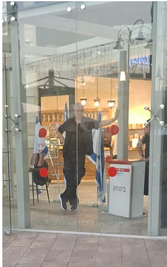
כניסה לקניון עופר, רחובות 9/24