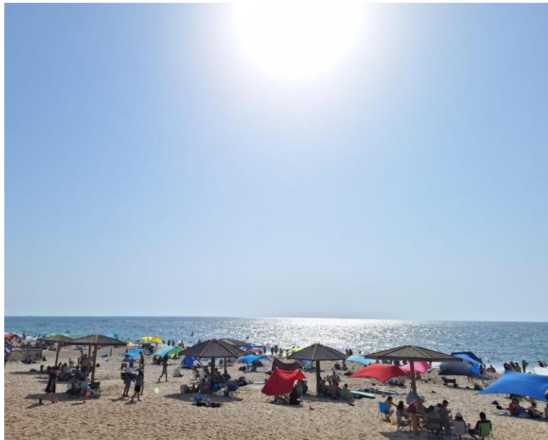
חוף פלמחים אוגוסט 2025