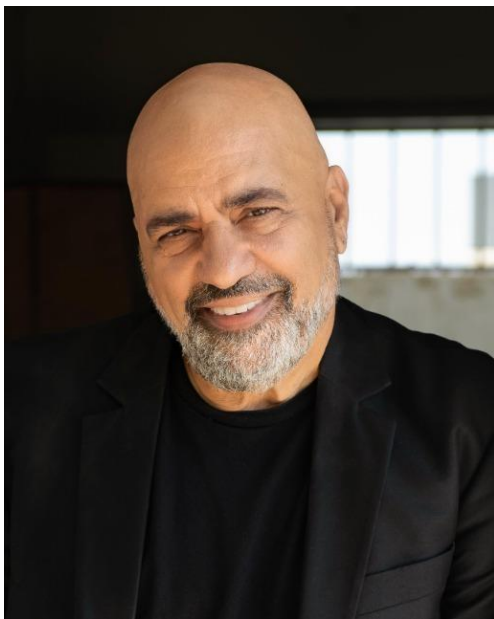
דני רובס

דני רובס כתב את השיר בהשראת סיפורי החיים של כוכבי רוק שהידרדרו אל מותם בשיא הצלחתם, כגון אלביס פרסלי, ג'ניס ג'ופלין, ג'ימי הנדריקס וג'ים מוריסון. רובס סיפר שכתב את השיר לפני פריצתו לתודעה הציבורית, כאזהרה לעצמו. חלקים בשיר נכתבו על רובס עצמו. בית הכנסת המתואר בשיר הוא בית הכנסת הגדול ברחובות שנמצא סמוך לבית בו גדל.