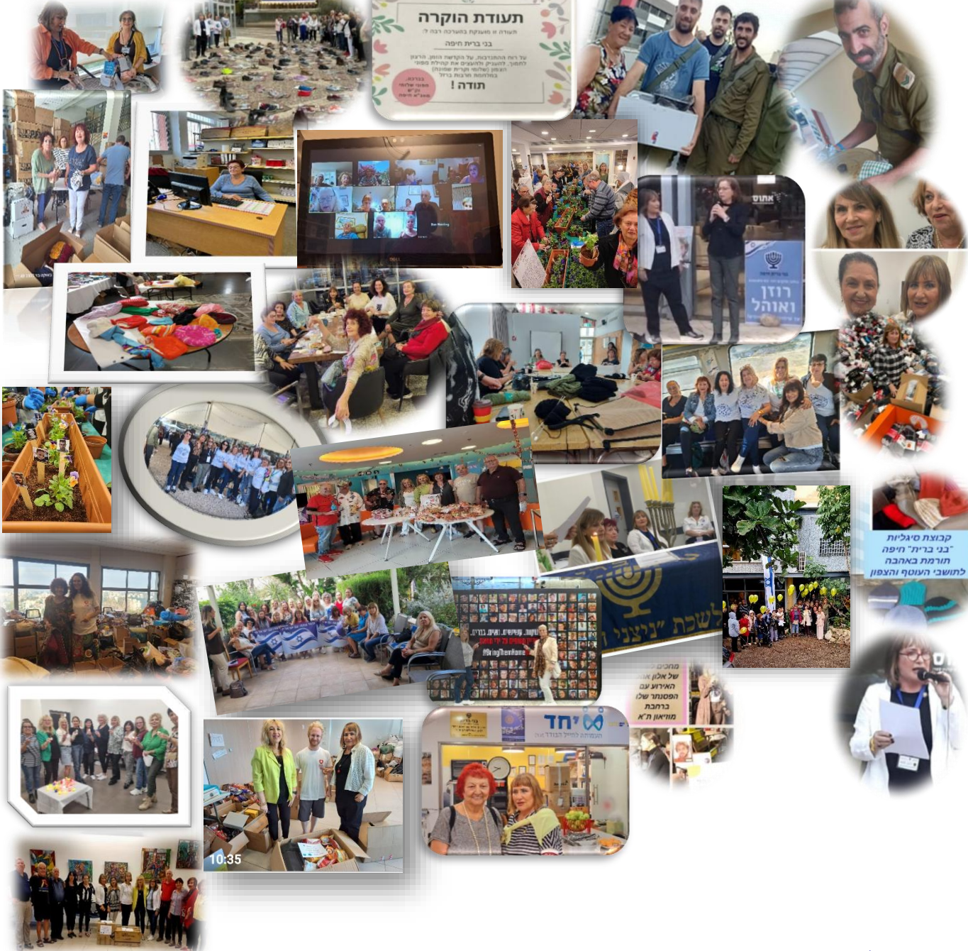
קבוצת סיג'ליות "בני ברית" חיפה תורמת באהבה לחושבי העוסף והצפון