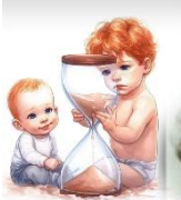
עוד קצת אתם בבית