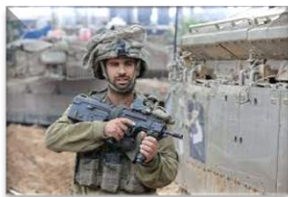
סא"ל תומר גרינברג ז"ל

הגענו במהירות אל הטנק שהיה באמצע שטח בנוי צפוף מאוד. חלק מהכוח מכנס לטנק שהעלה עשן מחניק, אותו כוח חילץ מתוך הטנק 3 גופות ופצוע קשה. חלק מהכוח הזה היו המ"פ והסמ"פ שנפגעו כתוצאה משאיפת עשן במהלך הפינוי. לקחתי פיקוד על הפינוי, וכאשר הגענו לנקודת ההחלף פינו אותם לארץ. הוחלט שאני אתפוס את מקום המ"פ וטובים מעתה את כוח הפינוי, וגדוד 13, כמו גדוד 13 - ממשיכים לעבוד. סיימנו את הפינוי ויצאנו מיד חזרה לגדוד. נכנסנו לסג'יעה. הצטרפנו לגדוד וכבר באותו לילה זיהינו וחסלנו מחבלים. העבודה בסג'יעה הייתה קשה ומאתגרת, אך מספקת מאוד. הצלחות כבר מאותו לילה בו נשארנו בלי המפקדים של הכוח, נתנו לנו מוטיבציה להמשיך לעבוד קשה. המשכנו להתקדם בתוך סג'יעה, הפינוי הבא שלנו היה בתקרית נוראית ארוכה בה נהרגו תומר גרינברג מג"ד גדוד 13 ורועי מלדסי מפקד פלוגה ב.