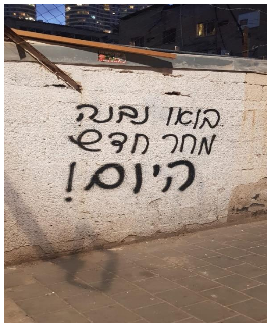
תל אביב, רחוב שונצינו, אפריל 2021