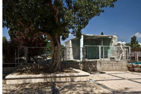
קבר נבי צלאח ברמלה