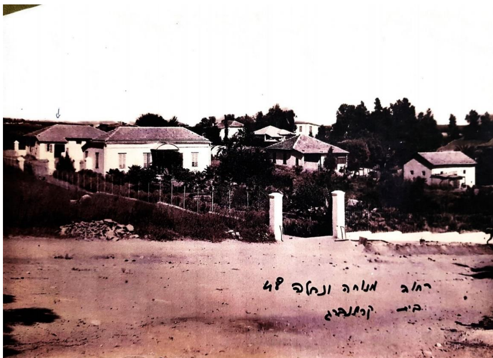
מבט מכיוון מערב משמאל לגדר ומצפונה לה – רחוב תר"ן