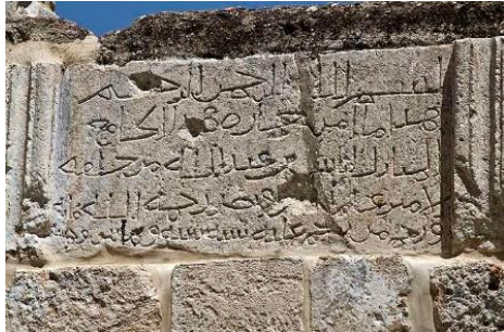
כתובת המספרת על שיקום קבר נבי צלאח במתחם המסגד הלבן ברמלה

שברמלה. הם התחפשו לערבים, נטמעו בין הקהל, שמעו על תכנון ההתקפה על רחובות, ושוב לדווח על כך לסמילנסקי. 7