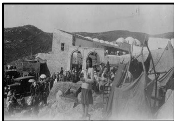
אלבום דוד בנבנישתי, ישראל נגלית לעין, יד בן צבי

מספרים, כי בעלי מלאכה היו באותו מקום לפני החג והעירו את לב החכמים בעלי המקום לתקן את המעקה הרופף והעלול ליפול. ה"חכמים" התרשלו בדבר ודחו את התיקון לאחר החג. והדבר מובן, כשהקדושה נהפכת למשא ומתן, לעסק של תגרנות, שמחליפים אותו במטבעות השוק, אז מתגלה כל הכעור שבאדם.