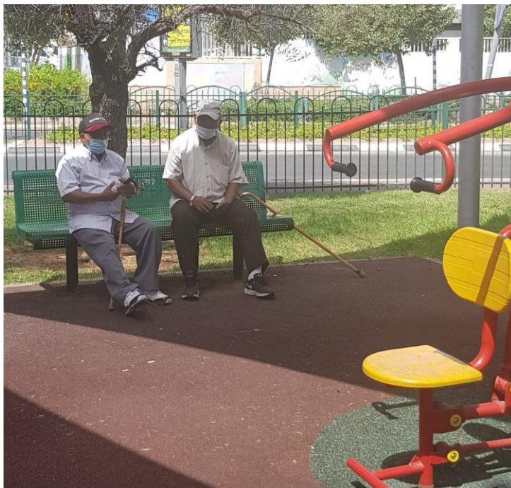
שדרות הקיבוצים, רחובות, ספטמבר 2021