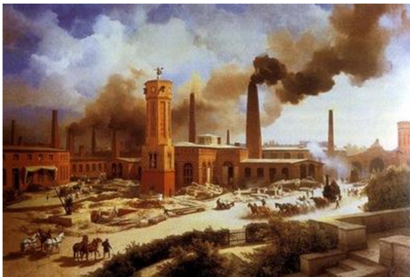
המהפכה התעשייתית מתוך אנציקלופדיה "אאוריקה"

המחיר של המהפכה התעשייתית כבד מנשוא. הפער בין עשירים לעניים גדל מאוד. תוחלת החיים של העניים התקצרה מאוד. ולאט לאט התחילה להתפתח מודעות מעמדית, קמו תנועות פועלים ואיגודים מקצועיים שדאגו לשכר בעת מחלה, חופשת לידה לאישה, לוויה ראווה. מתחילים לצוץ רעיונות אודות סוציאליזם ולפי מרקס הסוציאליזם הינו רק שלב אוטופי והחברה תתקדם משלב זה לקומוניזם, תוך מאבק מעמדי, לפועלים אין להם מה להפסיד פרט לכבליהם.