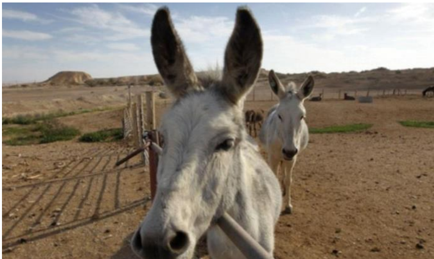
מעריב on line

החיילים עומדים המומים, עוקבים במבטיהם אחרי החמור החומד חלקת פרדס המרוחקת מעט מהמחסום והחל קופץ, מדדה, לכיוונה. הזקן רואה את חמורו, בבת עינו, מתרחק החל מתחנן, בוכה, עובר בין החיילים ומבקש להביא את החמור. הוא ידע בדיוק כמונו אם החמור יתרחק אולי כבר לא יראה אותו יותר. ואז קם בוריס "איש השום" הענק שגם ביום כיפור כמו שבשאר ימי המילואים נהג לאכול שום כאילו פיצח גרעינים. אמר בקולו העבה "ייציק. לא מבין. זה רק חמור בלאד וזה זקן ערבי בלאד אז יובפויומט תן לזקן חמור שלו, תן לזקן כבוד שלו וגמרנו". קריאתו של בוריס הגיעו גם לאזניו של החמור, הוא זוקף את אזניו, מקשיב לרגע ואז משמיעה כמה נעירות והחל מסתובב ובכמה קפיצות חצה את המחסום. השמש נטתה לשקוע רב סן אציק ועוד כמה חיילים צמים עלו לאוהל בית כנסת לתפילת נעילה. נשמעה תרועת השופר ולאחריה קול שירתם של החיילים "לשנה הבא בירושלים" ובא למחסום גואל.