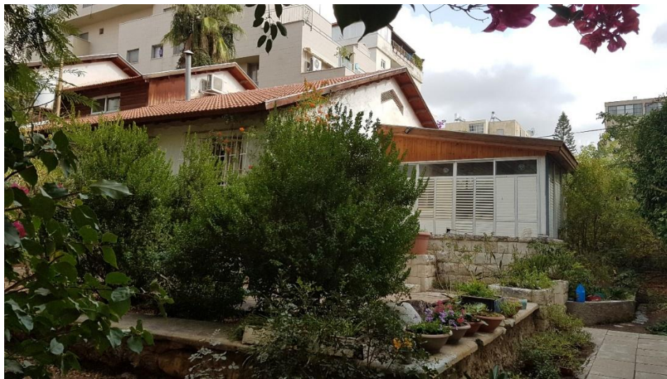
בית ישע ב- 2021

ישע נפטרה ממחלה ב- 25 בנובמבר 1938 ונקברה בגבעת ברנר. הבת תמר נישאה לגרשון היינמן ולהם שתי בנות: עפרה קציר, ועליזה שוורצברג (גרה ברחובות).