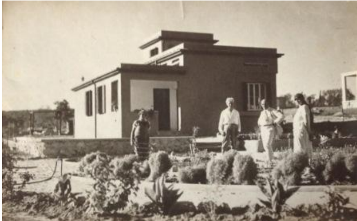
הבית של ישע בסוף שנות ה-20

כחלזון עירום העומד להיכנס לקונכייתו...". במאי 1927 הושלמה הבנייה והן עברו להתגורר בביתה.