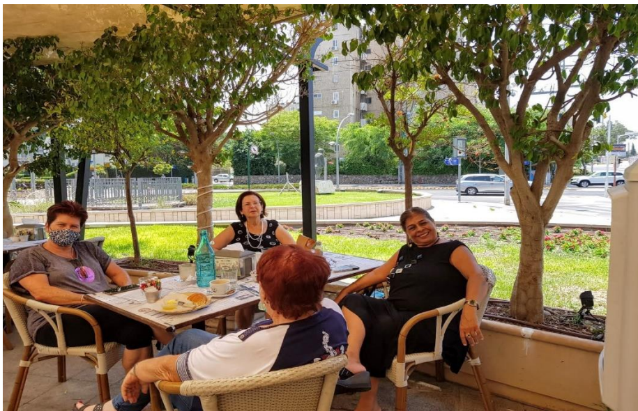
ידידות נשים רבת שנים