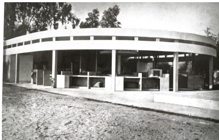
מבנה השוק ברחובות 1933