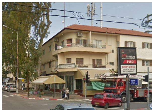
בית "וישנבסקי ברודסקי" רחוב ויצמן מס' 1 רחובות

חיה רעייתו נפטרה בגיל 72 באפריל 1979 ונקברה בבית העלמין ברחובות. בשנת 1991 מרדכי עבר עם בנו לדיור מוגן בנווה עמית, המשיך בפעילותו ההתנדבותית, תרם מניסיונו ועזר בניהול החשבונות של המוסד. מרדכי נפטר בגיל 100 ביוני 1996 ונקבר ליד חיה אשתו.