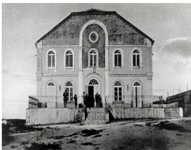
בית הכנסת הגדול "אוהל שרה"