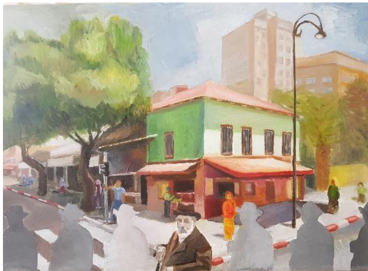
רח' יעקב פינת רח' הרצל, עם דיוקנו של יעקב ברוידא, צייר צבי תדמור

בה חיי קהילה. 50 המגרשים נועדו לבניינים ציבורים ולמגורי מתיישבים שלא היו איכרים בעלי נחלות חקלאיות. מרבית המגרשים היו בני דונם.