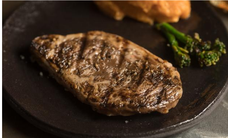
מזון העתיד-סטייק תרבותי שהודפס בטכניון