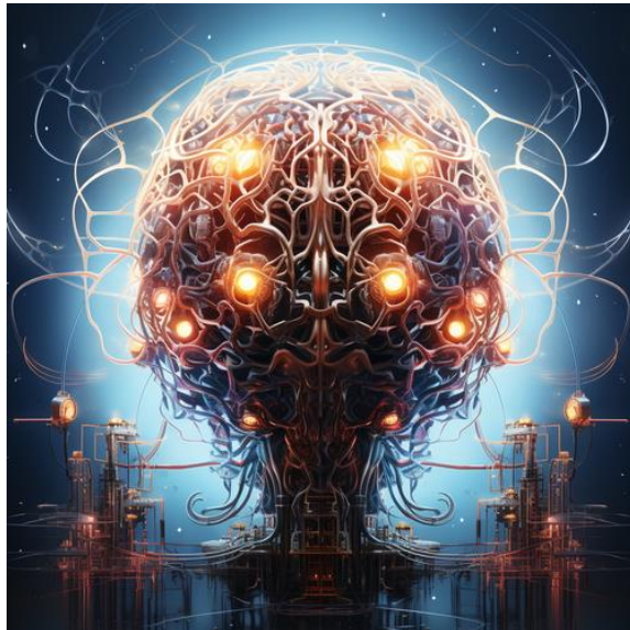
תמונה של בינה מלאכותית שנוצרה ע"י בינה מלאכותית Midjourney

שנת 2025 היתה רצופת ארועים לאומיים ועולמיים שעשויים או עלולים להיות ברי השפעה בטווח הארוך כולל חילופי שלטון בארה"ב (טראמפ מתמנה נשיא), המלחמה הנמשכת באוקראינה, סיום המלחמה בעזה והחזרת החטופים ועוד ועוד. בשנה זו התחוללו גם התפתחויות חשובות במדע וטכנולוגיה שעשויים להשפיע על חיינו בטווח הקרוב והרחוק. אין