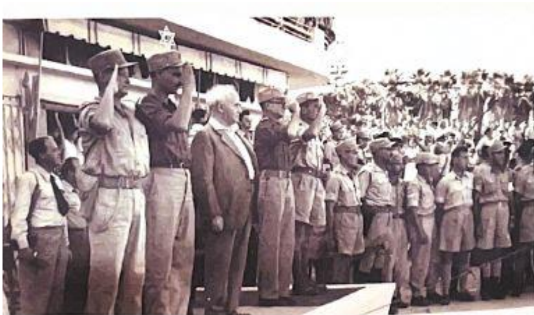
מצעד חטיבת גבעתי ברחובות, ספטמבר 1948