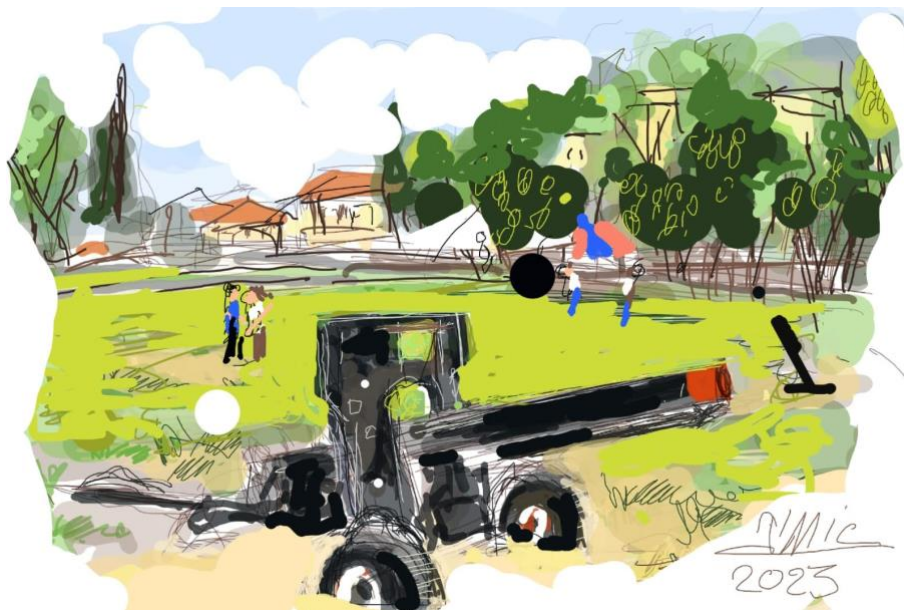
גן המגינים ליד יד לבנים ברחובות, צייר מיכאל זלטקין