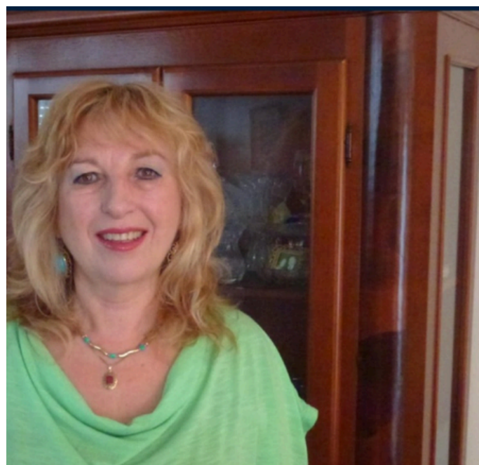
כתבה : ד"ר ריקי שלומי לשכת ניגונים