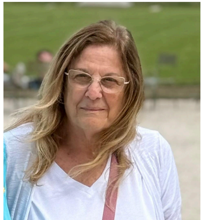
כתבה : תלמה רוזן לשכת "סיליות"

בחיפה פועלים במספר מתנ"סים "פינות חמות" למען האכלוסיות בגיל השלישי. הזקוקים מאוד למפגשים משמעותיים בתחום הבריאות ואחד הנושאים המרכזיים והרגישים שבהם הוא תחום הבריאות. לאור ניסיוני הרב בהדרכה ובהיכרות מעמיקה עם התמודדות עם בעיות של איבוד שתן בגיל השלישי, נענית להזמנה להגיע ולתת כלים וטיפים מעשיים להתמודדות. שמחתי מאוד לגלות קבוצה מגוונת של נשים וגברים. כבר בפתיחת המפגש הדגשתי בפני המשתתפים כי הם יכולים לשמש שגרירים להעביר את הידע והמסרים הלאה לחברים ולבני משפחה, שכן מדובר באחת הבעיות השכיחות והכואבות, שלעיתים מונעת מאנשים לצאת מהבית, לפגוש אחרים ולשמור על אורח חיים פעיל. במפגש השני קיבלתי מהקבוצה משוב מרגש ומעודד: חלק מהמשתתפים דיווחו על שיפור אישי בהתמודדותם, ואחרים סיפרו שסייעו והעבירו את הכלים שקיבלו לאנשים נוספים. אם נסכם אדם לעולם אינו נכשל: או שהוא מצליח, או שהוא לומד.