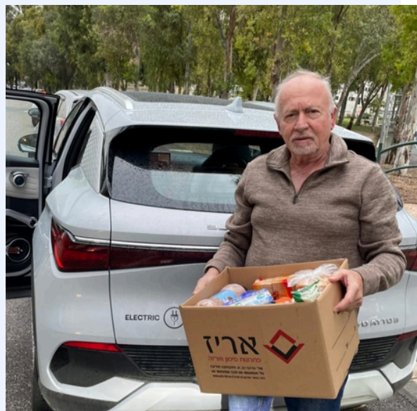
כתב: פנחס רום לשכת "סיגליות"

"לקראת שבת" היא עמותה התנדבותית לחלוקת ארגזי מזון לנזקקים. הצטרפתי לחלוקת הארגזים כבר לפני מספר שנים. החלוקה מתבצעת מדי יום חמישי, כאשר המזון הוא תרומה של עסקים חיפאים ומערכות שלמה של נוער וחיילים מפזרים את המזון לארגזים. כל משפחה מקבלת 2 ארגזים לקראת שבת. תפקידי הוא לחלק ל-5 משפחות הגרות ברח' אלנבי בחיפה בכל יום חמישי בשעה 16:00. מרגש אותי כאדם, כל שבוע מחדש לראות באיזו ציפייה המשפחות ממתינות לארגזים אלה מלאים בכל טוב.