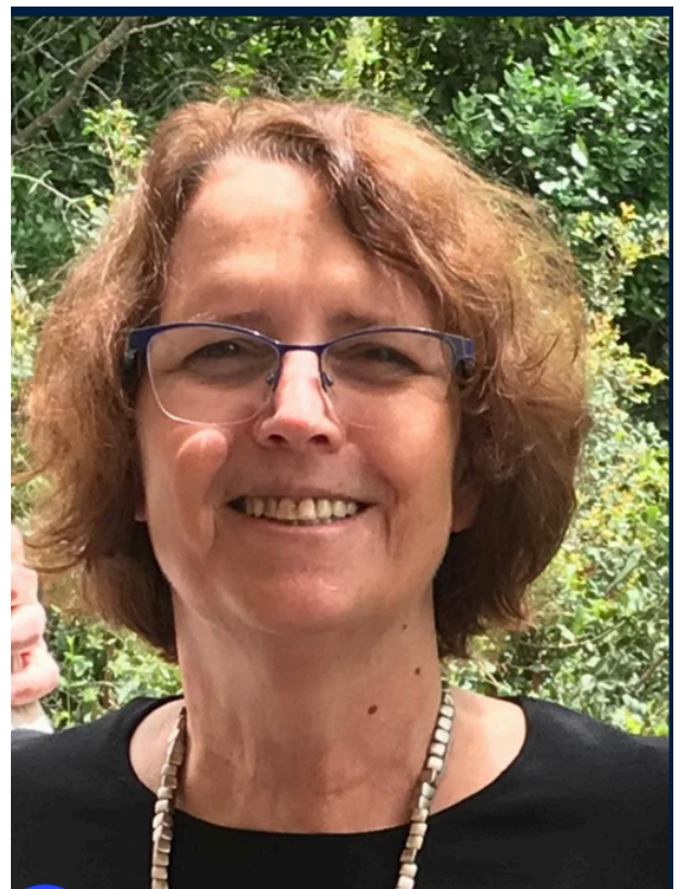
כתבה: נינה אונגר לשכת "רקפות"

זו חוויה שמחברת בין ידע, מעשה ורגש בצורה שאין דומה לה.