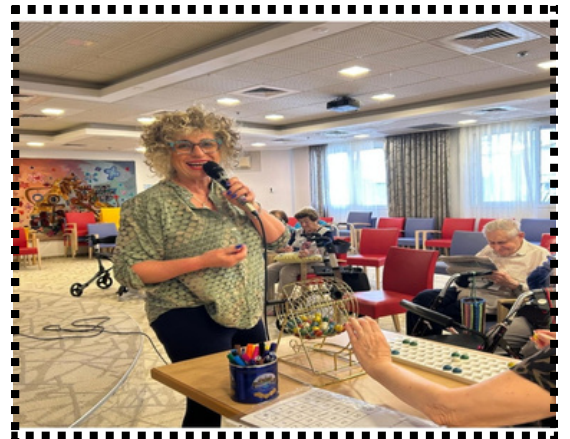
כתבה: אסי גוטמן לישכת "לילך"

משמעות, חום וקשר אנושי להגיע ולהתנדב בבית ההורים. לא צריך הרבה – רק לב פתוח ורצון לתת. השאר קורה מעצמו.