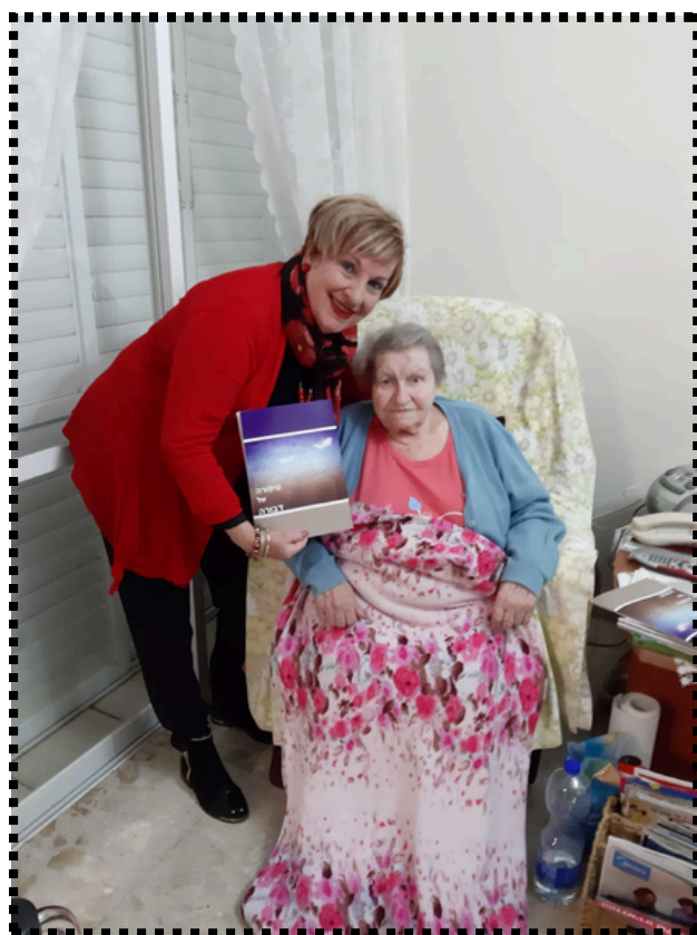
כתבה : נילי לופט לשכת "נחשון"

הכתיבה מלווה צחוק ודמעות והקשר בינינו מתהדק מאוד. לפעמים המספר/ת מזכיר לי את אחד מהורי או מישהו מבני משפחתי. בהפסקות שותים קפה ומשוחחים ונוצרים קשרים חברתיים. הספר נכתב והפגישות נמשכות מספר חודשים. כאשר סיימנו את הסיפור. הוא מודפס ונערכת בדיקה והגהה. המספר מצרף מסמכים ותמונות משפחתיות מפות דרכים ותעודות. והעבודה נמשכת למיקום כל התוספות. אז נמסרת היצירה לדפוס וכריכה. לספר מותאם שם ונשלמה המלאכה. הרגשת סיפוק וגאווה. אני מרגישה המון שמחה כמעט כמו לידתה של יצירה חדשה. לפעמים הקשר נמשך עם המספר ומשפחתו ואף עושים טקס קטן לקבלת הספר וחשיפתו. מחלקים למשפחה ומכרים וכולם שמחים שיש תיעוד לדורות הבאים הכותבים כמוני פועלים בהתנדבות כמו כן הגרפיקאית והדפוס. כל הפרויקט נתמך על ידי יד שרה. המעודדים את המזכרת הערכית והחשובה. אני מלאת סיפוק ושמחה. כתבתי כבר כ 6 ספרים. הספרים נמסרים למשפחה. לכותב ולספריית יד שרה... במידה ורוצים המשפחה יכולה להדפיס עותקים נוספים.