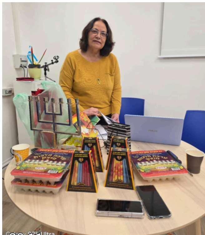
כתבה: מרים זבולוני לשכת "כוכבים"

עבורי, הליווי הזה הוא זכות גדולה. המפגש עם צעירים מאוכלוסיות שונות, ההקשבה לסיפורי חייהם והיכולת להיות חלק מתהליך של צמיחה והצלחה – ממלאים אותי סיפוק וגאווה עמוקה.