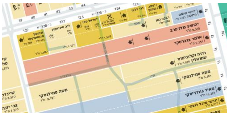
קטע ממפה של מגרש בוכרסקי בין רחוב יעקב (ימין) לבין רחוב ויצמן (שמאל)

נעשתה הפקעה קודמת, כאשר הרחיבו את התוואי של רחוב ויצמן. על יתרת שטח המגרש נבנו שני בניינים משותפים: בחזית רחוב ויצמן ובחזית רחוב יעקב. ההפקעה ממגרשו של בוכרסקי הנמצא מערבית וצמוד למגרשו של יהושע גולדברג [שתרם את מגרשו לוועד המושבה] כללה: שביל המוביל לגן רנה סמילנסקי, והחלק השני של הגן, בניין ב"ס שריד, הרבנות, ובית הכנסת ברחוב גולדברג.